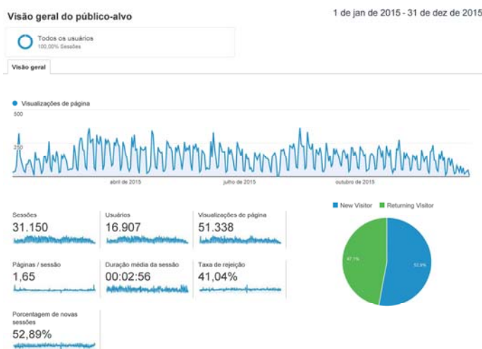
Gráfico completo gerado pelo Google analytics - Análise do Público alvo: